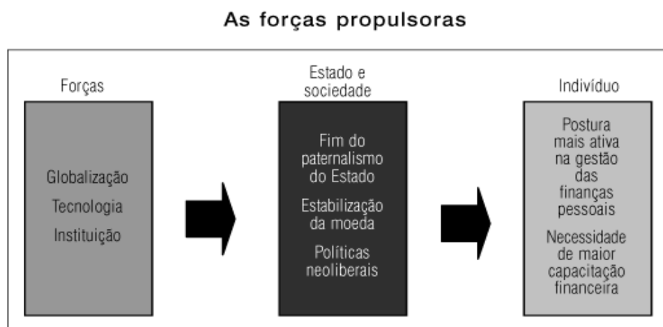
Figura 1: Forças propulsoras nas relações econômicas e sociopolíticas.

Fonte: Savoia, Saito e Santana (200, p. 1123).