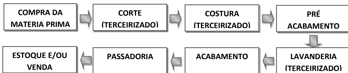
Figura 1 – Processo Produtivo – DL Fashion Confeção Ltda.

Na empresa DL Fashion Confeções Ltda., após observação sistemática e entrevistas informais com os proprietários, foi constatado as devidas divisões do processo produtivo exposto na figura 1: