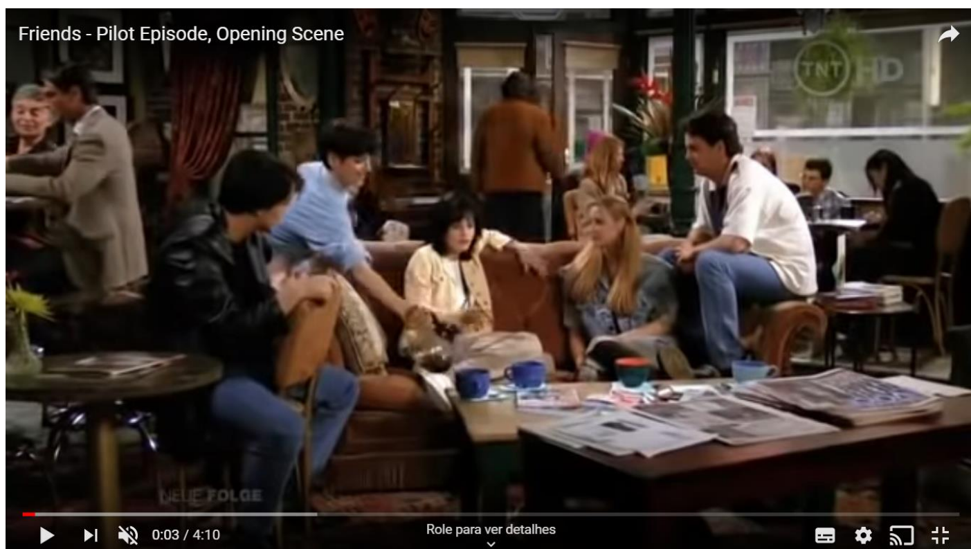
Figura 1 - Imagem da cena utilizada no estudo. Friends 1ª temporada episódio 1

Os resultados dos participantes assinalaram para as contribuições advindas da utilização da metodologia de aplicação da série, para ilustração observemos a figura 1, aliada a neurolinguística na aprendizagem de LI. Foi possível observar, por meio dos dados, que as percepções dos alunos mostraram que a atividade envolvendo essa metodologia pode contribuir para absorção do conteúdo, pois a maioria dos alunos obteve êxito com as respostas certas para os exercícios conforme podemos observar na análise das atividades individualmente: